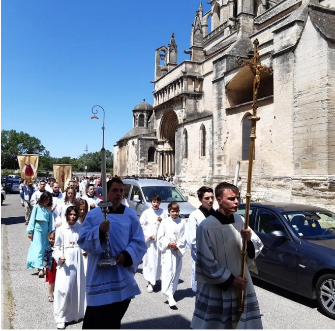
Départ de la procession, du parvis de la collégiale Sainte Marthe.

dès la fin de la messe, la statue de Notre-Dame du Château est portée en procession, à travers les petites ruelles de Tarascon, avec notre curé, les religieux présents, les Propédeutes, les jeunes filles et garçons qui ont professé leur foi, les prieurs de Notre-Dame du château, les familles et les paroissiens, au monastère de la Visitation pour y être laissée là, deux jours durant, à la vénération de nos Sœurs Visitandines.