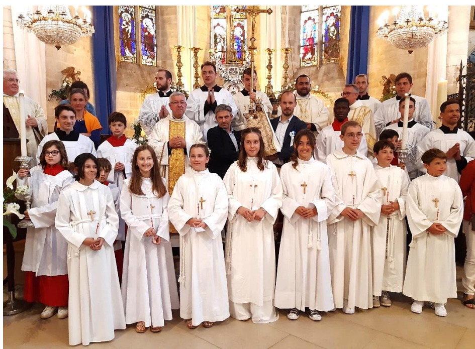
Petite photo de famille prise en fin de messe.